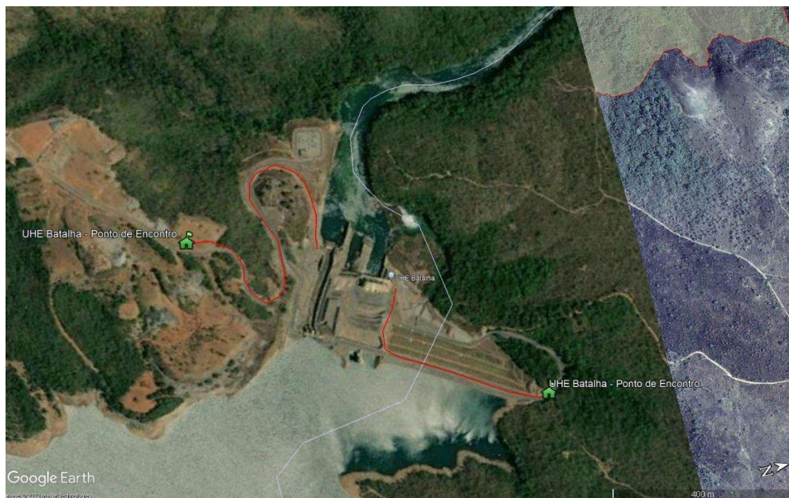
Figura 1 – PEs e RF da UHE Batalha.

A Figura 1, a seguir, apresenta os pontos de encontro e rotas de fuga deste empreendimento, que se encontram também em KMZ.