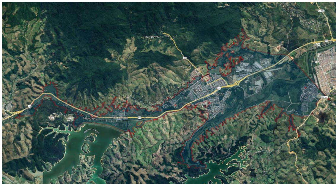
Figura 1 – Caracterização da ZAS da usina.

Os danos à vida, às propriedades e às comunidades a jusante de uma barragem, em caso de ruptura das estruturas, estão intimamente relacionados à densidade populacional, à capacidade de resistência dos bens expostos ao evento e à resposta dos indivíduos ocupantes da área afetada. O entendimento da dinâmica de ocupação permite que o planejamento das ações de resposta seja realizado de maneira mais adequada e eficaz.