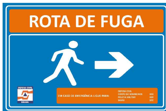
Figura 5 - Modelo de Placa de Rota de Fuga (Seta para a Direita).

O projeto inicial previa a instalação de placas de rota de fuga a cada 50 metros e sempre que houvesse mudança de direção, conforme orientação estabelecida na IT 001/2021.